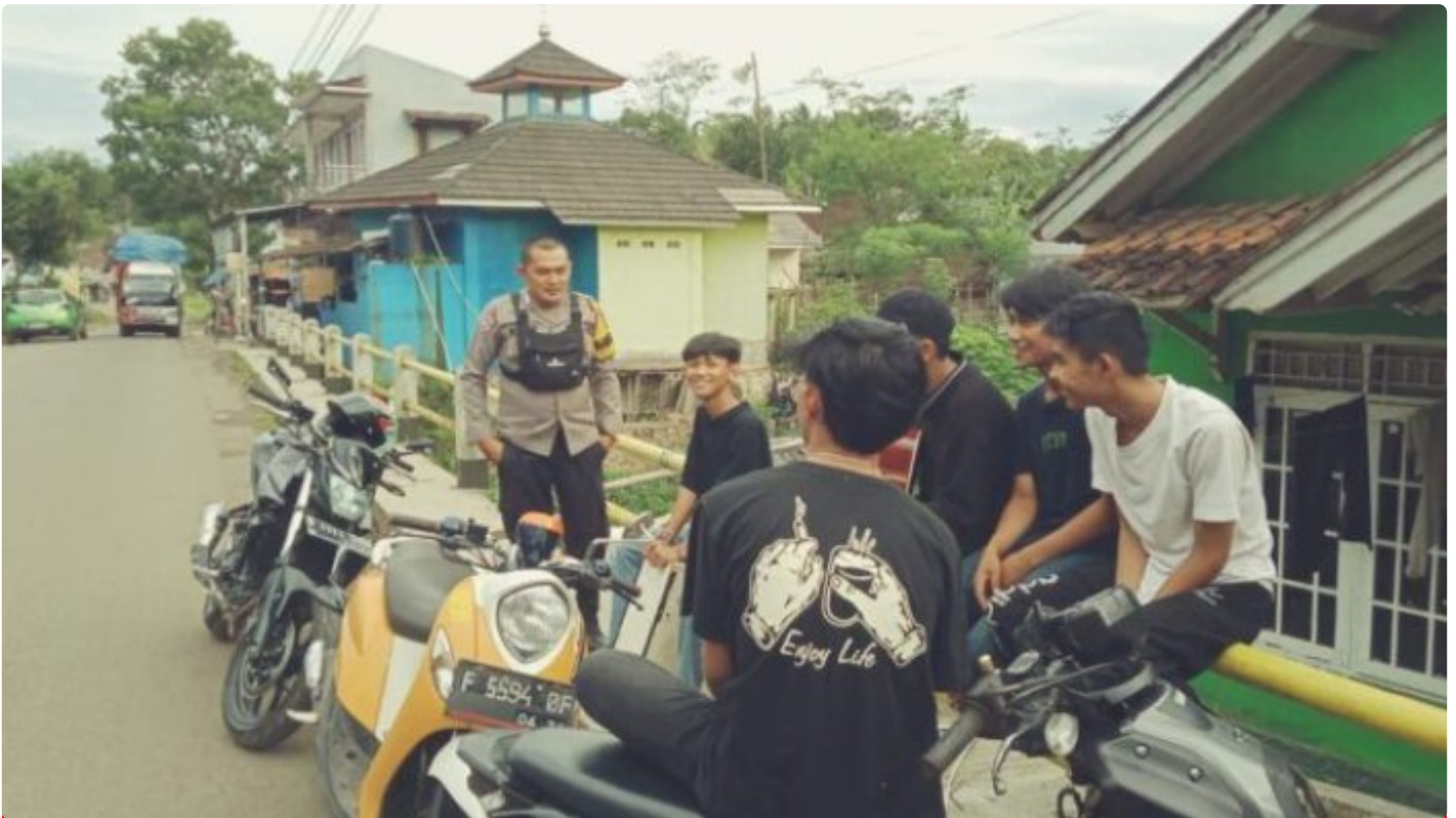
Polsek Cireunghas Polres Sukabumi Kota

Kota Sukabumi – Polres Sukabumi Kota Polda Jawa Barat – Polsek Cireunghas melaksanakan kegiatan dialogis dengan para pengemudi angkutan umum di jalan sempur, Selasa (30/1/24). Kegiatan ini bertujuan untuk menyampaikan himbauan kamtibmas kepada para pengemudi dan meningkatkan kerja sama antara kepolisian dan masyarakat dalam menjaga keamanan dan ketertiban di wilayah